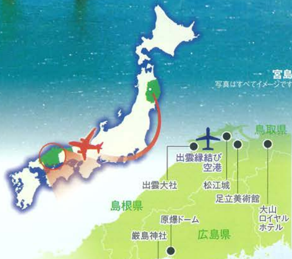
宮島 写真はすべてイメージです