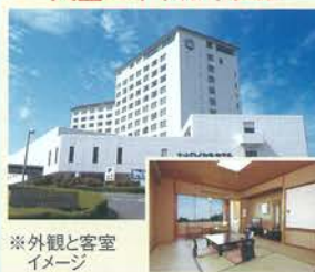
※外観と客室イメージ